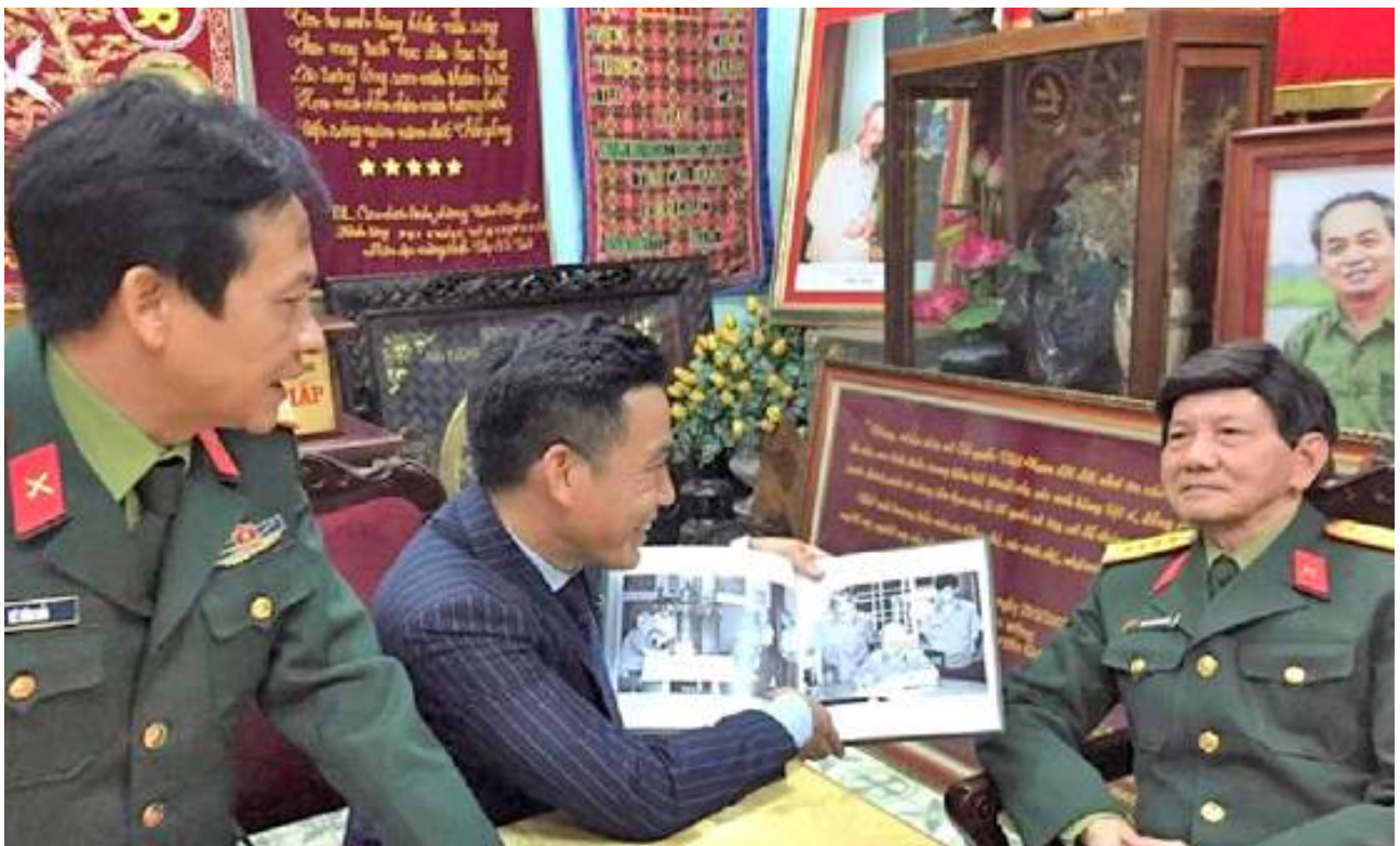
Nhà báo Vương Xuân Nguyên ôn lại những kỷ niệm về những ngày được ở bên Đại tướng Võ Nguyên Giáp cùng Trợ lý và Thư ký của Đại tướng.